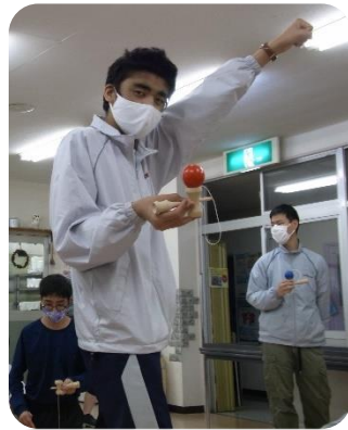
【たくさん練習！ 家でも自主練！ からのドヤ顔♪】