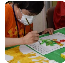
【イメージと想像力を膨らませて… ちぎり絵や水彩画】