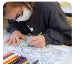
【取り組む内容は園の余暇プログラムと ほぼ同じです。 黙々と進め、最後に発表。続きは家で…】