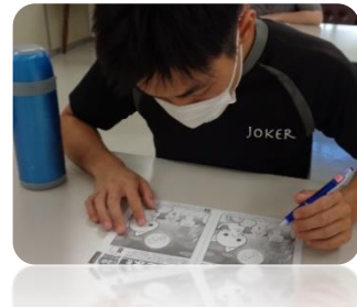
【徐々に高まる難易度。夏休みには各自お勧めを 探して紹介】