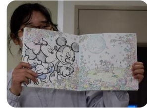
【時間が経つのを 忘れて全集中】