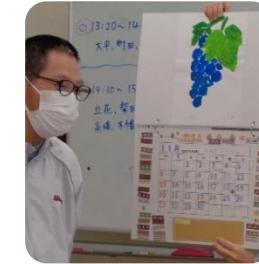
【ちぎり絵は カレンダーに】