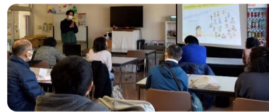
【久々の再開、目的を確認しスタート】