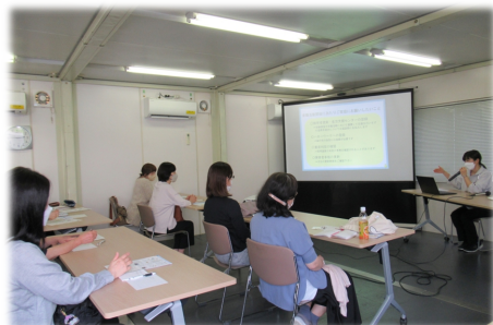
【一番好評だった就職先情報 （就労移行支援事業）】

今後はさらに家族の知りたい情報を受け取る為の「家庭にとっても大切な」そして、「あかね園にとっても」家庭への大切なメッセージを発信する定例会となりますので次回以降も是非、皆さんご参加下さい。