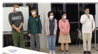
【役員に選ばれた方々】

5月24日にはオンラインの在職者交流会をZOOMにて行い、7名の参加がありました。また、6月10日に今年度1回目となる地域意見交換会、14日に対面形式の在職者交流会を予定しています。年度内にコロナ禍で長らく出来ていなかった外出もふれあい会で企画していければと考えております。（近藤）