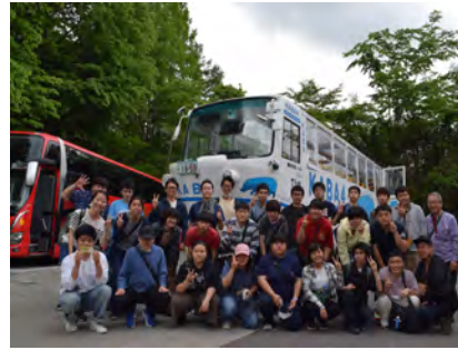
リニアモーターカー見学