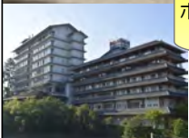
ホテル磯辺ガーデン 舌切雀のお宿