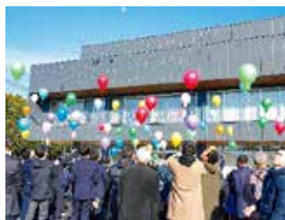
開所当初の再現。風船に思いをのせて。

利用者への新園舎お披露目から約2か月後の3月10日に外部の方をお招き、法人あひるの会新園舎竣工式を開催致しました。