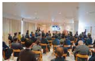
宮本市長からの祝辞（左）と会場の様子（右）